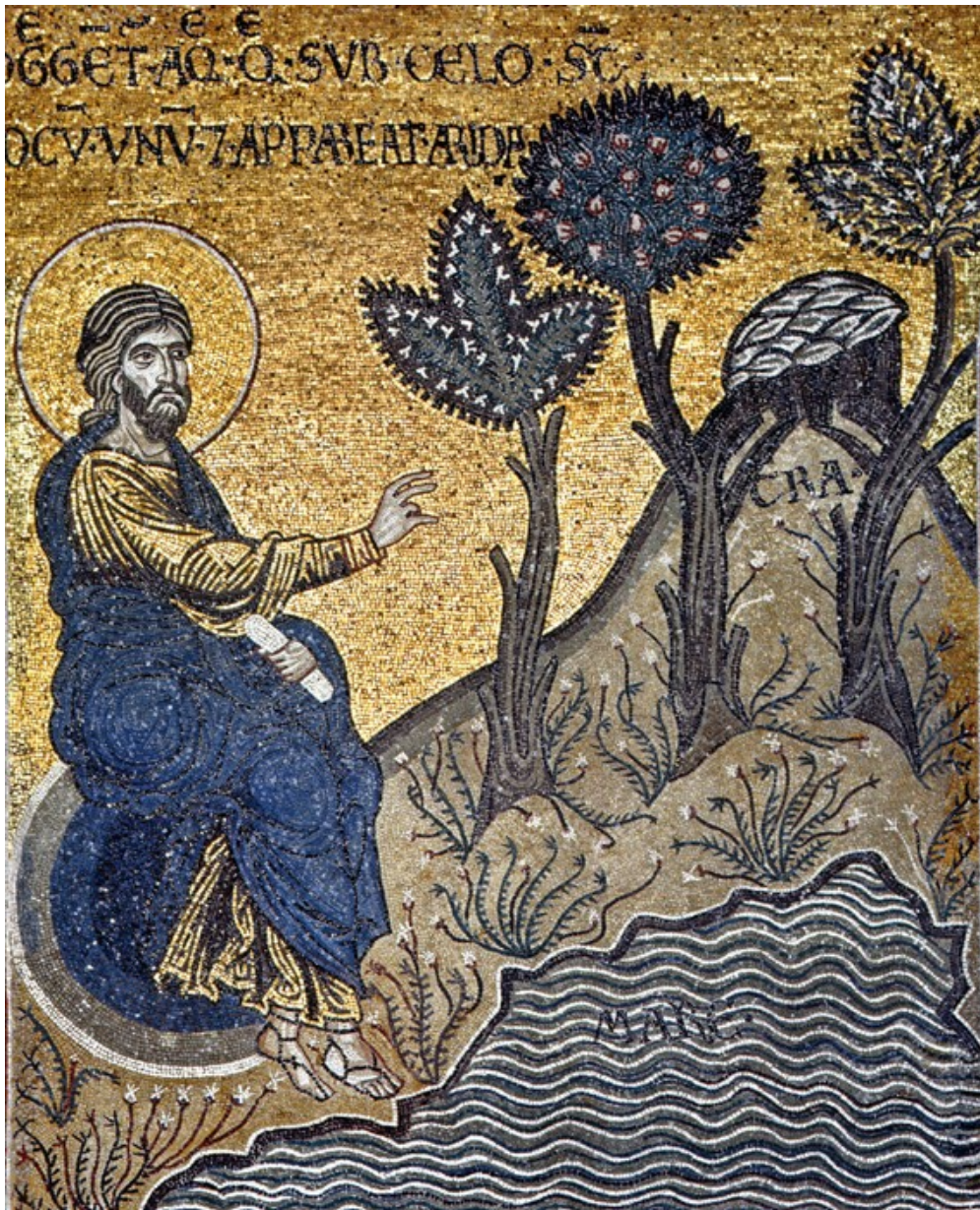
Création de la terre ferme - Mosaïque de la cathédrale Santa Maria Nuova de Montreale (XII e s.) en Sicile.